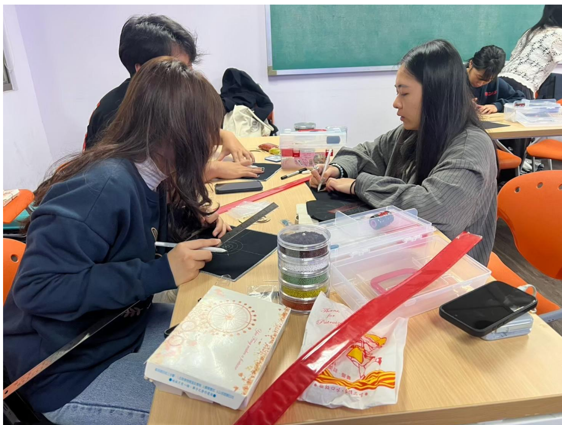
▲老師講解構圖方式與繡法

十字繡、珠繡課程提供學生二至三種圖騰，討論圖形的難易度與配色，講解起針、縫製、壓線、收針等等，講師詳細的手把手帶領學生操作，因此手作文化課程是非常重視小班制教學的品質，希望每位同學都可以在課程中習得技藝、完成作品，也讓學生了解，單單完成一件手作配件需要投入大量時間與精力且專注當下，體會一針一線的不易，逐漸建構出內心所想的圖案時，是別於學業之外的感動與收穫。