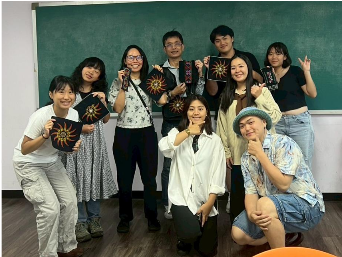
▲部分學員、老師合照